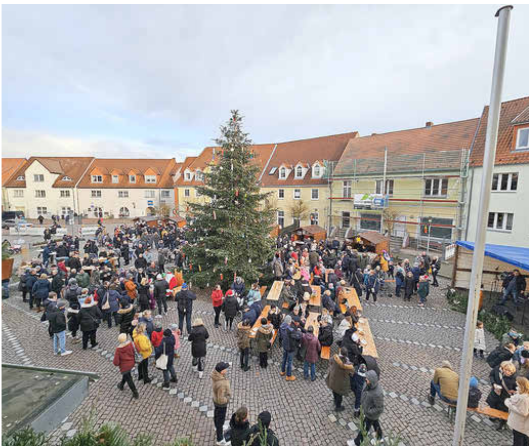
Weihnachtsmarkt am 17. Dezember 2023

Amtliches Mitteilungsblatt des Amtes Tessin