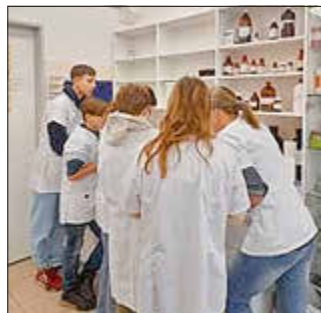
Betriebsbesichtigung in der Apotheke im Tessinum

Ende Januar und Anfang Februar hatten die Schüler und Schülerinnen der 7. Klassen die Möglichkeit 2 Betriebe ihrer Wahl im Rahmen der Berufsorientierung zu besuchen.